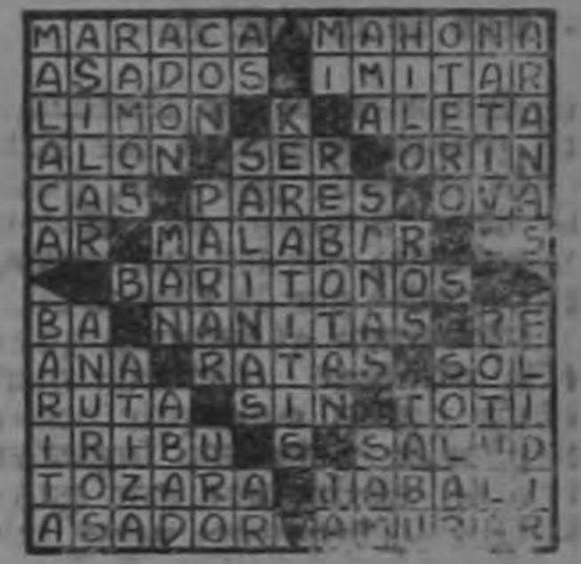
SOLUCION DEL PROBLEMA ANTERIOR

novela de Wiedman fué adaptada por Vera Caspary y dialogada por Abraham Polonsky; la película fué fotografiada por Milton Krasner y cuenta con un bello fondo musical de Sol Kaplan.