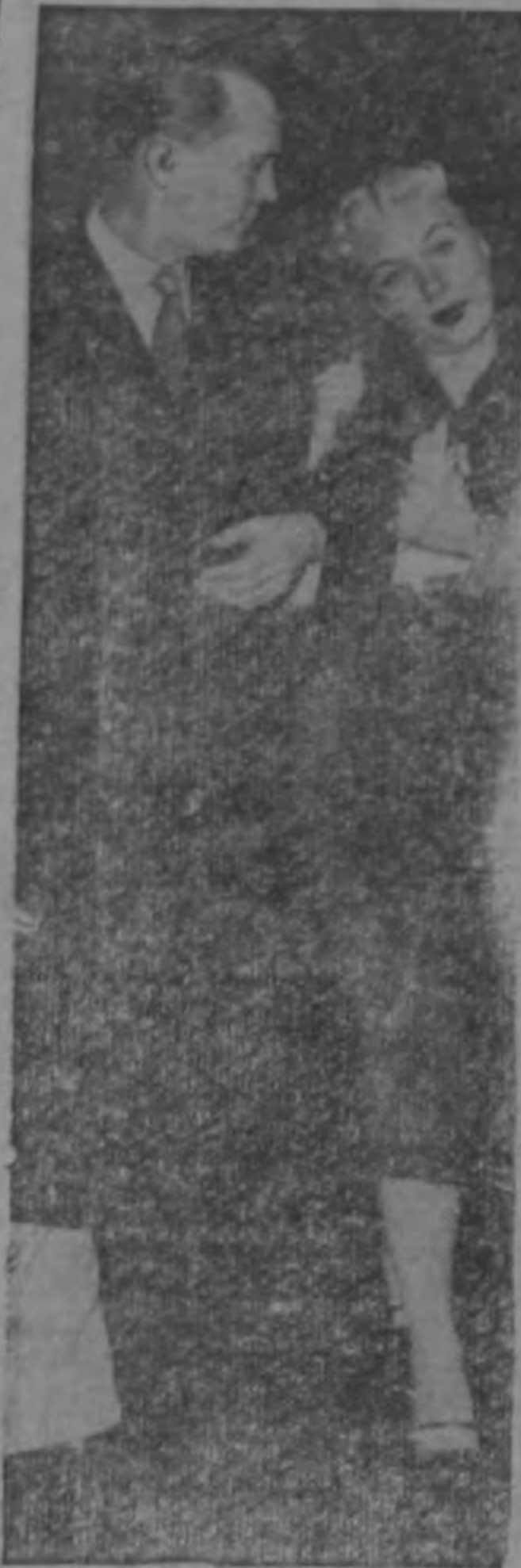
Del brazo dado, el actor Franchot Tone y su esposa Barbara Payton, salen del aeródromo de La Guardia, en Nueva York, a donde llegó Barbara procedente de Hollywood. Desvirtuaron así los recientes rumores de que Barbara se iría a México con el actor Tom Neal, con quien Tone tuvo un pugilato poco antes de su boda.