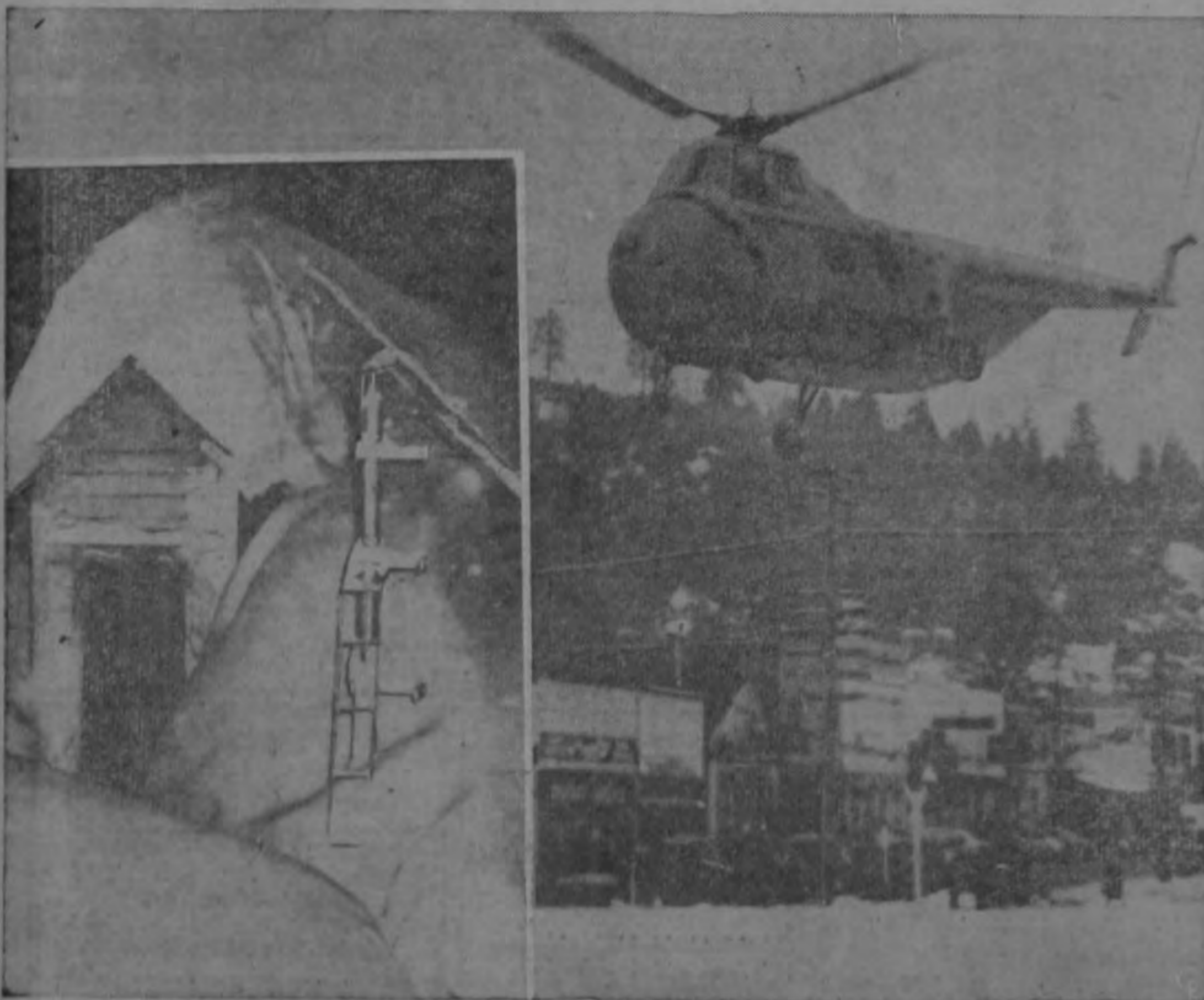
Un helicóptero de los guardacostas que puede llevar 10 pasajeros, regresa a Colfax, California, obligado por una nueva tormenta a posponer su vuelo en ayuda de los 222 ocupantes del expreso "Ciudad de San Francisco" que está bloqueado por la nieve. El helicóptero intentaba evacuar a las 27 "casos de camilla" que se dice hay en el tren. Ilustrando gráficamente las tormentas que han dificultado las operaciones de rescate, se ve a la izquierda a una oficina telégrafica de los ferrocarriles en Emigrant Gap, Calif.